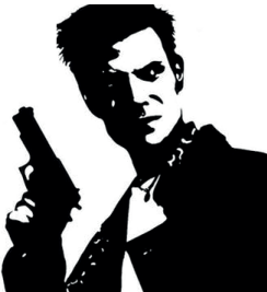
1. Max Payne